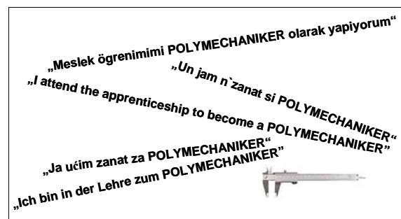
Abbildung 2: Die Sprachenvielfalt der Polymechniker

8 von 10 Teilnehmenden nennen Deutsch als ihre Muttersprache. Die anderen 20% stehen für eine Vielfalt von verschiedenen Muttersprachen und Herkunftskulturen im untersuchten Berufsfeld. Albanisch, Türkisch, Serbisch, Kroatisch und Englisch waren dabei am häufigsten als Muttersprache vertreten. Selbst Japanisch, Tagalog oder Tibetisch wurden genannt, um nur einige Beispiele der insgesamt 35 vertretenen Sprachen zu nennen.